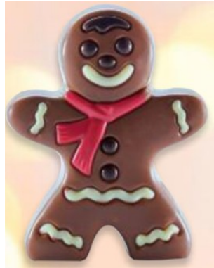
BONHOMME LAIT 60g – Réf : 932120