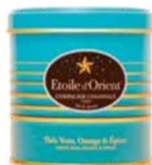
THÉ ÉTOILE D'ORIENT THÉ VERT, ORANGE et ÉPICES 30g – Réf : 066900 100g – Réf : 065200