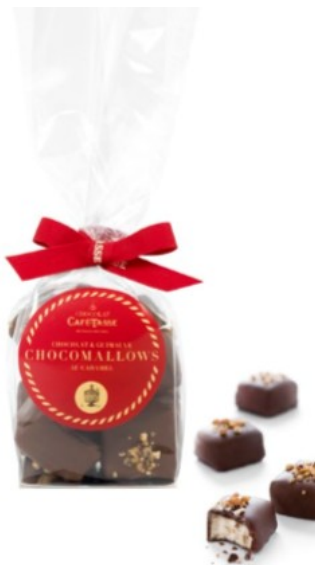
GUIMAUVES AU CAMEL ENROBÉES DE CHOCOLAT AU LAIT ET NOISETTES CARAMÉLISÉES 60g – Réf : 932120