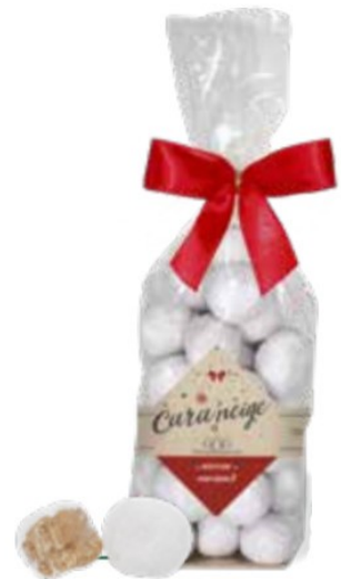
CARA'NEIGE 100g – Réf : 80203101524