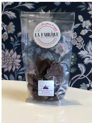
LAIT 100g – Réf : LAIT100