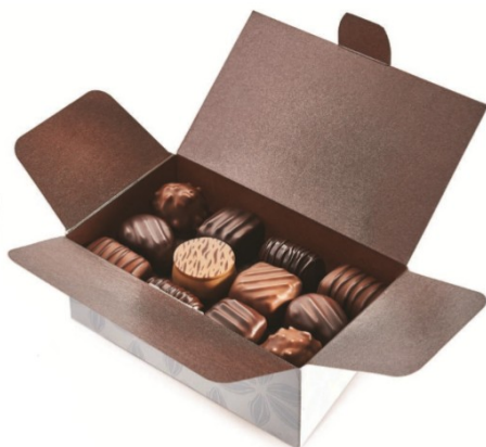
ASSORTIMENTS NOIR / LAIT 34 CHOCOLATS 350g – Réf : 918064