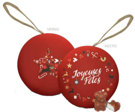
BOULE DE NOËL ROUGE AVEC OURSONS GUIMAUVES 40g – Réf : 80203101526