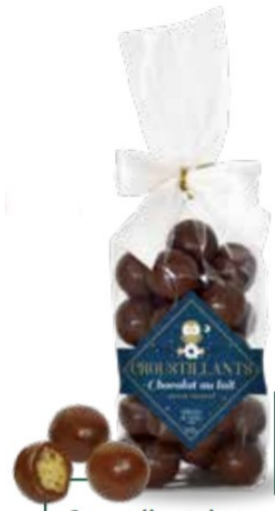
CROUSTILLANTS LAIT SAVEUR CARAMEL 100g – Réf : 80203400431