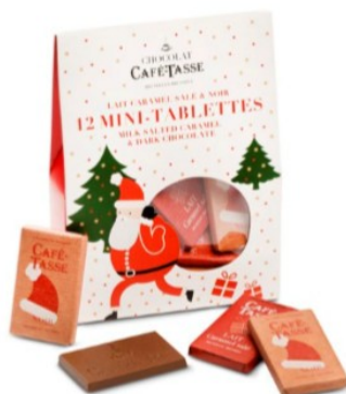
SACHET 12 MINI-TABLETTES LAIT / NOIR 108g – Réf : 8053XMAS