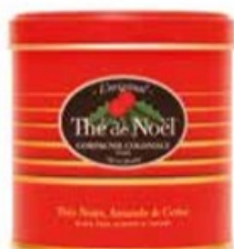
THÉ DE NOËL THÉ NOIR, AMANDE ET CERISE 30g – Réf : 991900 100g – Réf : 990200