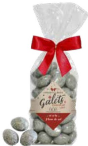
GALETS CHOCOLAT LAIT A LA FLEUR DE SEL 100g – Réf : 80203400443