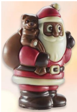
PÈRE NOËL AVEC SAC 75g – Réf : 938044