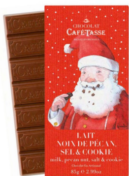
TABLETTE DE NOËL LAIT NOIX DE PÉCAN CRISPY SEL 85g – Réf : 5272XMAS