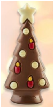
SAPIN LAIT 50g – Réf : 938028