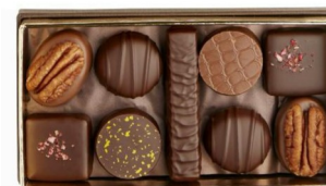
ASSORTIMENTS NOIR / LAIT 20 CHOCOLATS 215g – Réf : 918049