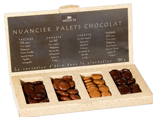
NUANCIER PALETS CHOCOLAT 180g – Réf : NUANCIER180g