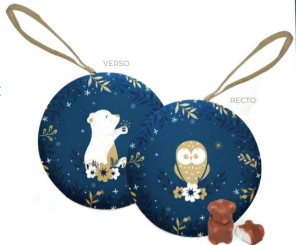
BOULE DE NOËL BLEUE AVEC OURSONS GUIMAUVES 40g – Réf : 80203101518