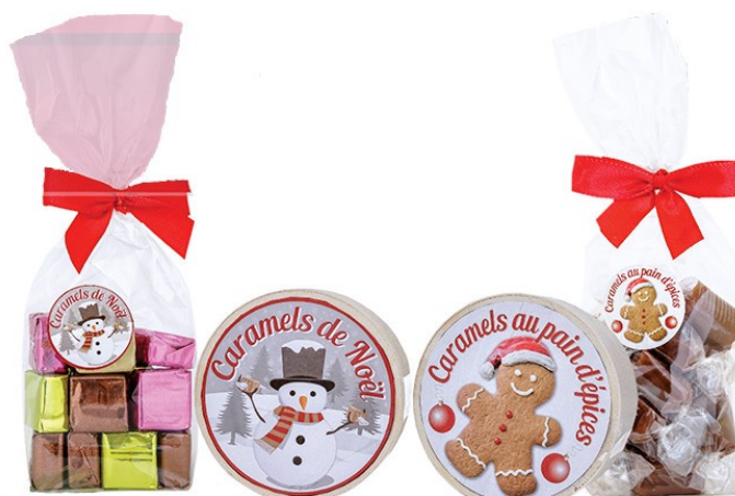
MINI BOÎTE CAMELS NOËL 50g – Réf : csmininoel