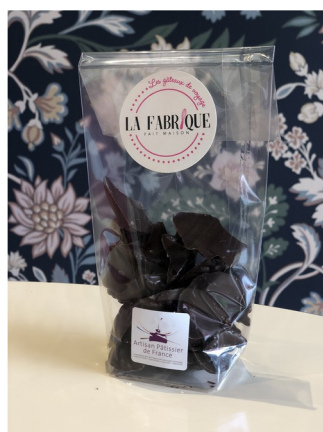
NOIR 100g – Réf : NOIR100