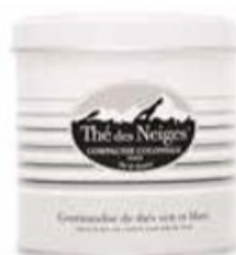
THÉ DES NEIGES MÉLANGE THÉ VERT ET BLANC 25g – Réf : 141300 90g – Réf : 140600