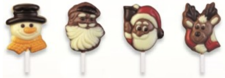
SUCETTES DE NOËL 15g – Réf : 935033