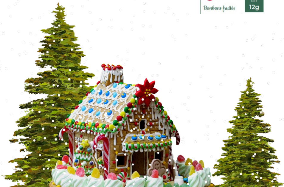
BOÎTE DE NOËL ÉCUREUIL 12g – Réf : 30203100318