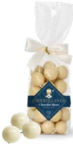
CROUSTILLANTS CHOCOLAT BLANC ET FLEUR DE SEL 100g – Réf : 80203400435