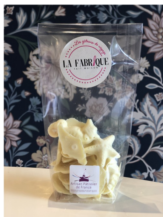
BLANC 100g – Réf : BLANC100