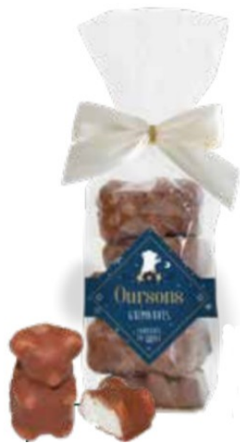
OURSONS GUIMAUVES 100g – Réf : 80203101517