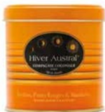
ROOÏBOS « HIVER AUSTRAL » FRUITS ROUGES / MANDARINE 30g – Réf : 190100 100g – Réf : 189500