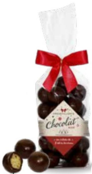
CROUSTILLANTS CHOCOLAT NOIR 100g – Réf : 80203400441