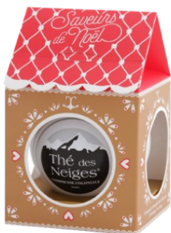
BOULE 10 SACHETS THÉ BERLINGO